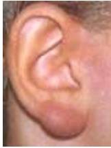
Figure 4 Lymphocytome cutané bénin ( http://www.vet-lyon.fr/etu/lyme/symptomes.tml )