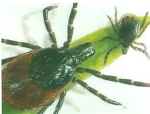
Figure 2 Tique femelle et jeune tique (nymphe) (site du syndicat des ophtalmologistes http://www.snof.org/maladies/lyme.html )

L'homme contracte principalement la maladie du printemps à l'automne, lors de balades en forêt, lorsque les tiques ou les nymphes (jeunes tiques) ( Figure 2 ) sont nombreuses.