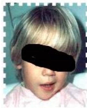
Figure 5 Paralysie faciale ( http://www.vet-lyon.fr/etu/lyme/symptomes.html )