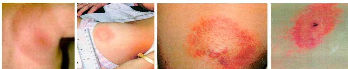
Figure 2 Exemple d'érythèmes migrants

Cette rougeur (érythème) n'est pas douloureuse et disparaît spontanément en quelques semaines. Elle n'est pas toujours présente (dans 30 à 50 % des cas) ou peut passer inaperçue.